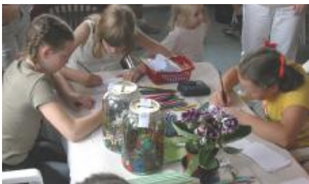
Malování pohlednic v domku Petra. Země živelka, 2005.

Dětsí návštěvníci výstavy zde v režii jihočeských knihovníků malovaly pohlednice, které pak pod hlavičkou naší veřejné sbírky také prodávaly – souhrnný výtěžek činil 10.000,- Kč.