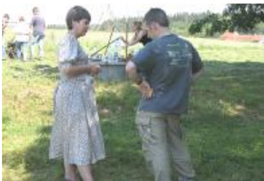
Paní velvyslankyně s jedním z pracovníků ambasády.