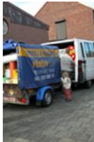
Při nakládání v Meersenu.