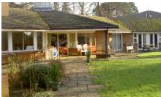
Útulná zahrada dětského hospice Helen House, Oxford.

Rok 2005 byl zakončen dlouho plánovanou studijní cestou po vybraných dětských hospicích ve Velké Británii. Projekt financovalo britské velvyslanectví v Praze a organizačně jej zajišťoval Nadační fond Klíček ve spolupráci s o.p.s. Energiea. Cesty se zúčastnil šestičlenný tým, připravující podklady pro prováděcí dokumentaci druhého objektu dětského hospice v Malejovicích (ošetřovatelské jednotky) - členy týmu byli dva lékaři, dvě zdravotní sestry, maminka, která se svým dítětem zažila neúspěšný konec onkologické léčby v nemocnici a je již deset let aktivní spolupracovnící Nadačního fondu a Sdružení Klíček, a dobrovolník-herní specialista. Účelem cesty bylo jednak seznámit se s různými modely dětské hospicové péče, jednak probrat se zástupci jednotlivých zařízení ošetřovatelské a technicko-provozní otázky související s naším projektem. Studijní cesta vedla přes Kinderhospiz Balthasar v německém Olpe, hospic Demelza House v Kentu, Helen House v Oxfordu, Acorn's ve Worcesteru, Horizon House v Belfastu a St. Oswald's v Newcastlu. Výstupem desetidenní exkurze byla nejen detailní zpráva z cesty, doplněná bohatou foto- a videodokumentací, ale také příslib profesionální pomoci a spolupráce ze strany všech navštívených hospicových domů.